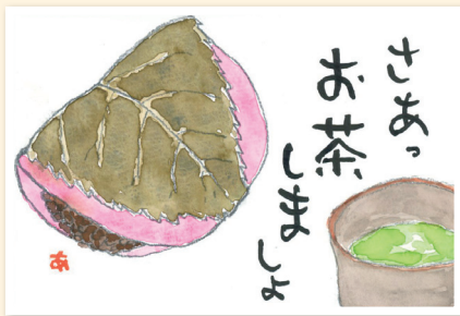
加美町 板垣篤子 (66)