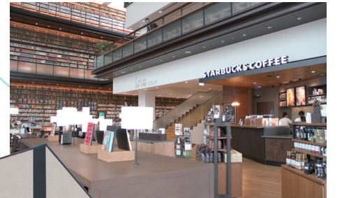
併設のコーヒーショップでも読書が楽しめる