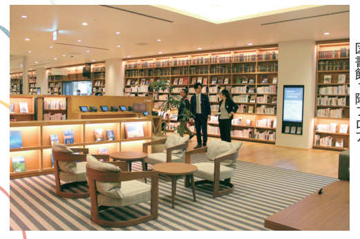
「リビング」をイメージした図書館1階フロア