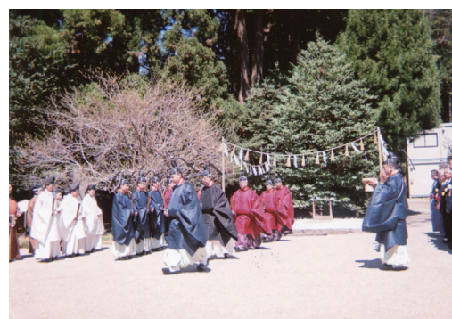
しだれ桜などを見に行った際に立ち寄った塩釜神社の祭りの様子