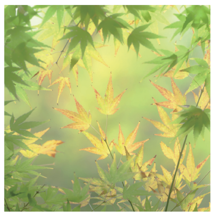
初秋(鎌倉市) 大河原町 吾妻克美(65)