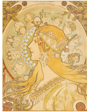
ポスター「黄道十二宮」 1896年/リトグラフ

家の中で、運命の女性たちに焦点を当て、水彩や素描、版画、関連写真など約150点の作品を展示している。