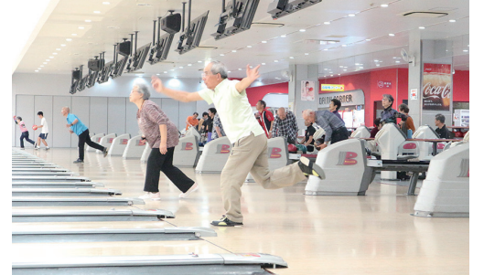
年齢を感じさせない軽やかな投球

ゲーム終了後は表彰式を実施。毎回スコアで順位を付け、男女別1・2・3位の他、男女混合で5・10・15・20位など計15人に賞品を贈っています。いつも同じ人が上位では変わり映えしないので、上位を取った人には、次回のスコアにハッピーキャップを付けるようにしています。