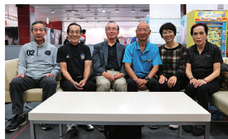
取材日に集まった役員の方々の皆さん。受け付けから表彰式まで司会進行する

会のモットーは「明るく楽しく健康的に」。毎月第2・4木曜13:30～14:30に、仙台市太白区西多賀の「ベガスベガス仙台南店」2階のボウリング場で活動しています。参加費は1000円で3、4人ずつでレインに分かれ、2ゲーム行います。