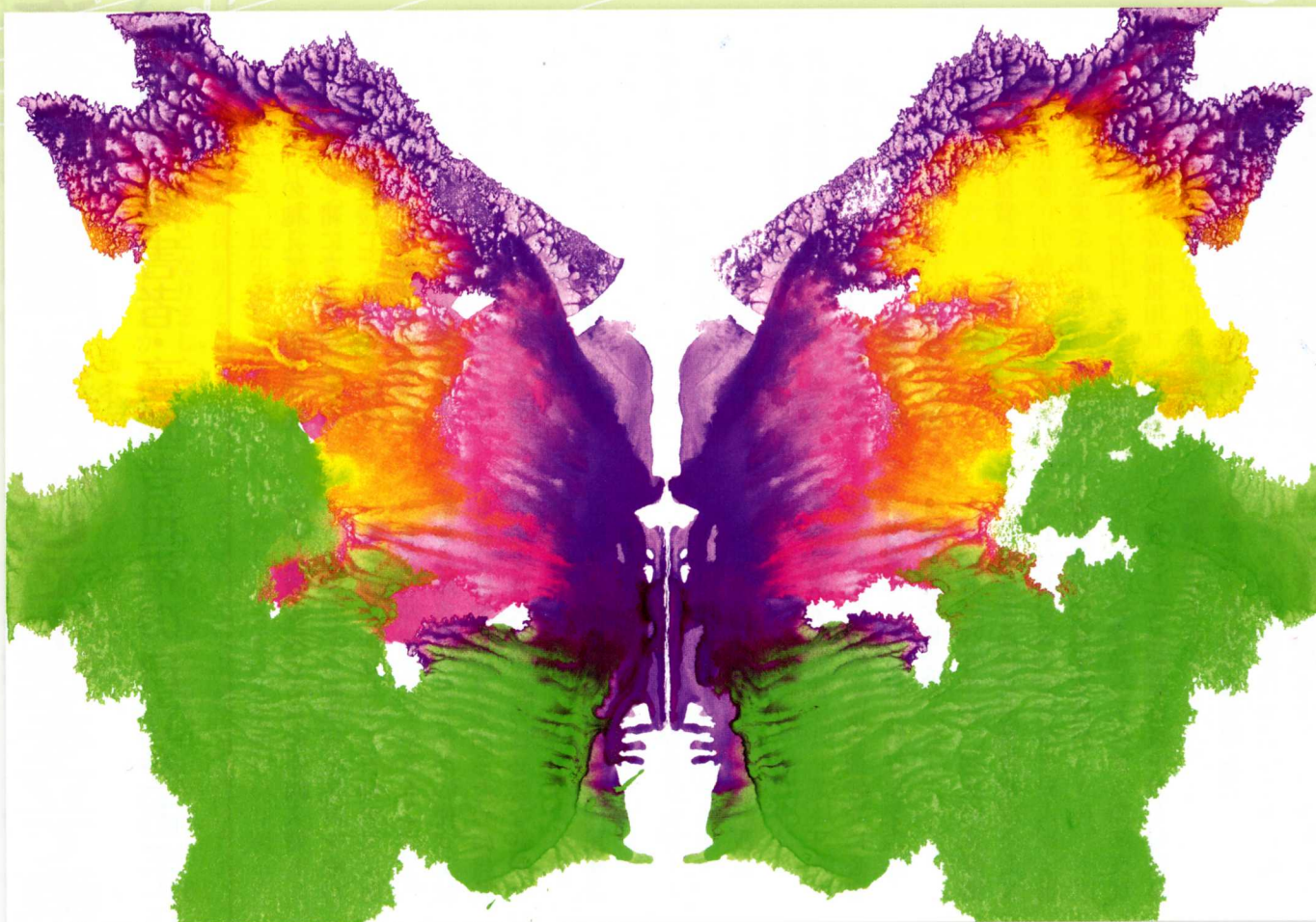
「蝶々」知的障害者更生施設白石寿光園の利用者さん …デカルコマニーによって偶然きれいな絵が出来ました。みなさんは、どんな絵に見えますか?…

今だから『生活福祉資金貸付制度』を利用して生活を立て直しませんか ～社会福祉協議会は、低所得・障害者・高齢者世帯の自立をお手伝いします～