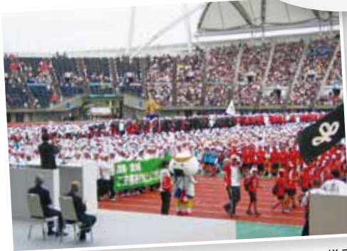
写真は昨年のくまもと大会での総合開会式の様子

「ねんりんピック」の愛称で親しまれる全国健康福祉祭は、60歳以上の方を中心にあらゆる世代がスポーツや芸術文化活動を通し、交流を深めることができる健康と福祉の総合的な祭典。宮城県内各地で4日間にわたり熱戦が繰り広げられる他、健康や福祉に関するイベントも数多く実施される。