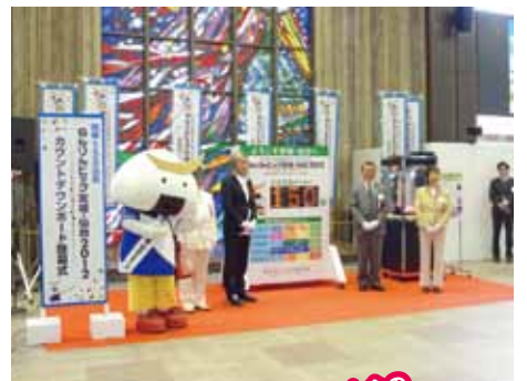
▲開催150日前の5月16日にJR仙台駅2階で行われた「カウントダウンボード除幕式」

仙台市青葉区の東京エレクトロンホール宮城ではシンポジウムが開かれ、来場者は公募制で、8月以降に専用ホームページや本紙いきいきライフみやぎで募集する予定だ。総合開会式・閉会式の来場者募集は7月1日(日)から。ボランティアは6月29日(金)まで募集中。各イベントの開催スケジュールや内容はホームページで確認を。