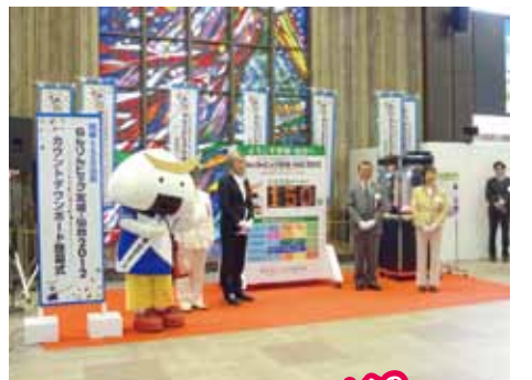
▲開催150日前の5月16日にJR仙台駅2階で行われた「カウントダウンボード除幕式」 ▲積み重ねる時間・経験・人生を、プレートを重ねることにより表現した大会メダル

ふれあいニュースポーツ、地域文化伝承館などが開催される。これらの催しはどれも参加自由。選手はもちろん、子どもから高齢者まで家族で楽しめそうだ。