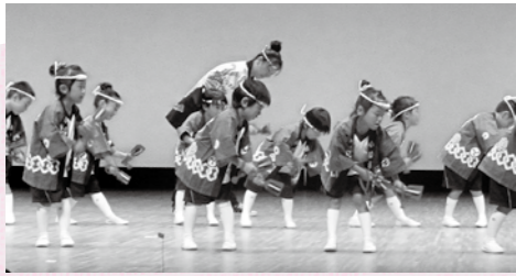
▲岩沼こぼと幼稚園の皆さん

まず舞台部門は、太極拳・民謡・社交ダンスなど各クラブ活動のステージ発表。太極拳はこの日のために練習に励んできた成果として入門太極拳「紫の霧」を披露することができました。民謡は宮城県を代表する祝い唄である「さんさ時