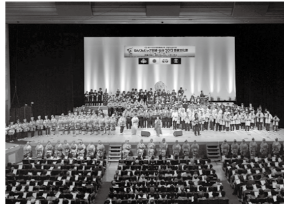
▲フィナーレで「わせねでや」を大合唱

音楽文化祭 14日の音楽文化祭（東京エレクトロンホール宮城）は、SCKガールズ（気仙沼から誕生したご当地アイドル）のオープニングを皮切りに、多賀城高等学校吹奏楽部や浦浜念仏剣舞（岩手県）など、県内外8団体の出演に加え、ゲストに加藤登紀子ミドリみちの空を迎え開催されました。