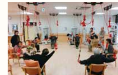
▲通所介護事業所やわらぎ

平成25年2月1日に建物を新築し開設した地域支援センターなごみなのでは、地域の高齢者や障害者などの利用定員を拡充し、通所介護事業をはじめ、居宅介護支援事業、訪問介護事業などを展開するとともに、地域の一般住民へも相談及び研修などの機能を開放するなど、地域に密着した在宅福祉サービスを提供し円滑な運営を行います。