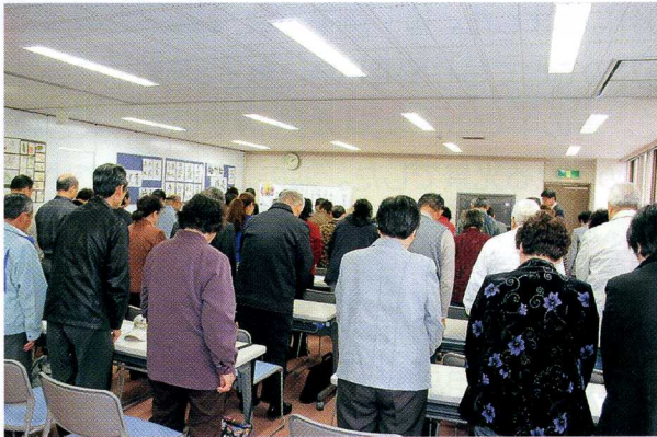
在开学典礼前,向在这次震灾中牺牲的各位追悼、默哀。

本中心在震灾后得到了各界的热情支援和鼓励,我们对此深表感谢。这些鼓励都将是支持我们的坚强动力。今年我们也将开办大家喜欢的各种讲座、希望大家踊跃参加。