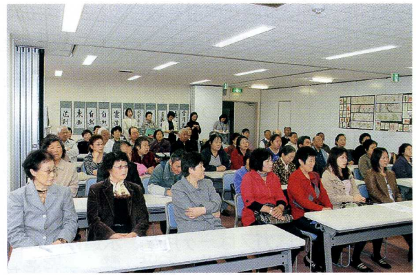
大家热心地听取了有关日语课程和交流活动的说明。

预定在3月13日(星期日)举行的日语学习发表会因这次东日本大震灾而中止。在开学典礼上、中心的教室里展示了大家的作品。在交流活动中精心制作的作品充分展现了每个人的个性、每一幅作品都精彩至极。