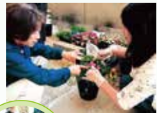
勤拍去枯萎的残花，美丽的花儿才会争相开放啊