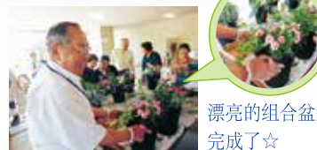
漂亮的组合盆栽完成了☆