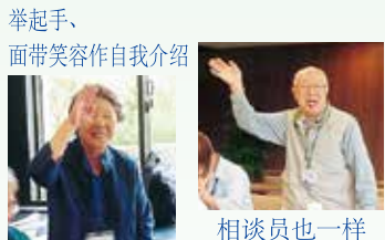
举起手、面带笑容作自我介绍