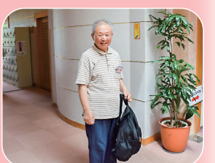
いい湯でした。 好舒服的温泉浴。