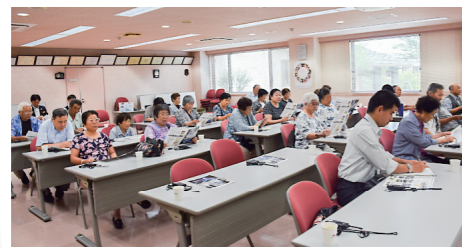
真剣に説明を聞いていた 洗耳恭听了说明