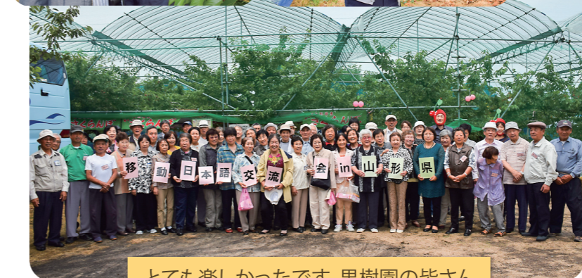
とても楽しかったです。果樹園の皆さん ありがとうございました。 特别开心。衷心感谢果树园的各位。