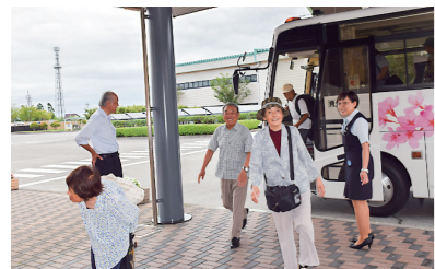
工場に到着 到達工場