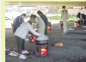
鍋8個分全て美味しくいただきました。 8鍋味の煮芋一扫而光。