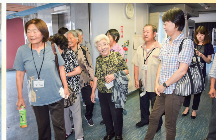
久々の再会に嬉しかったです。久违的再会大家甚是喜悦。