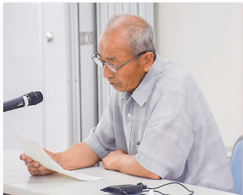
「私の日本語と日本での生活」