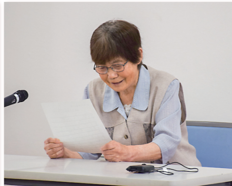
「日本には春夏秋冬があります」