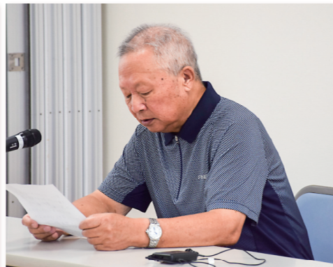
「生きている限り学ぶ」