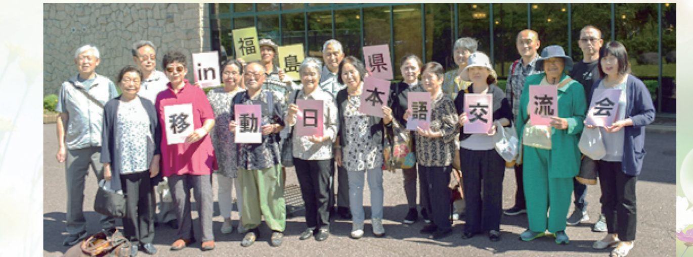
来年もまた会いましょう