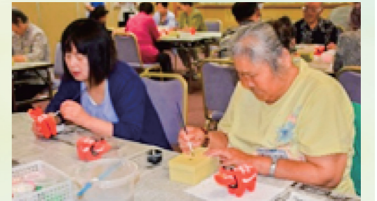
目玉の色付け難しいわ