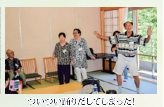
つつい踊りだしてしまっ!