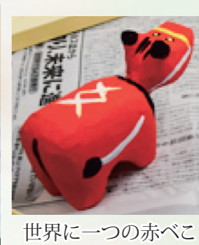
世界に一つの赤べこ