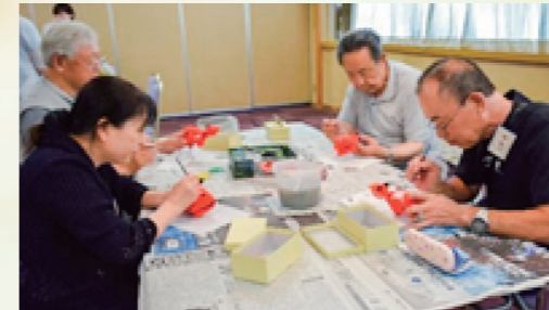
集中していますね