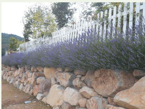
6月から7月にかけてラベンダーが咲く

東日本大震災の復興プロジェクトで開設され、今は約80種のバラと15種のハーブが栽培されている。夏に最盛期を迎えるハーブはラベンダーやセージ、ナススタチュム、レモンバーベナなど。園内のカフェではハーブティーで一息つける。自家栽培のハーブを使ったスブレールなども販売。要予約で香り袋の制作(700円)ができる。