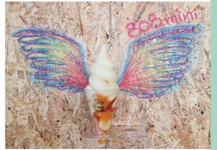
ヤオヤドットミニ 808.mini

青果店「生駒農場」(川崎町)が運営するカフェ。片手で手軽に味わえる「ハンディパフェ」(写真・650円)は、みずみずしい果物と甘さ控えめのソフトクリームがマッチする。リピーター続出の人気メニュー「バナナシェイク」(500円)などもある。店内の「写真映え」コーナーで撮影も楽しんでみては。新鮮な野菜や果物も販売している。