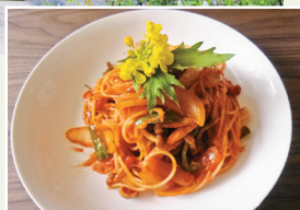
▶園内のカフェでハーブを使ったナポリタンが楽しめる

仙台市泉区福岡字赤下 開/9:30~17:00 休/6月は無休、7~11月は水曜 入園料/大人500円、小学生100円 ☎0120-027-028