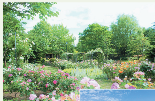
▲イングリッシュローズやフレンチローズに囲まれた「ローズガーデン」