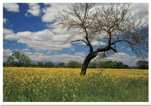
菜の花咲く(角田市) 仙台市若林区 後藤日出親(79)