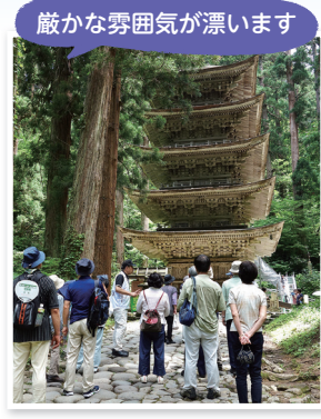
厳かな雰囲気漂います