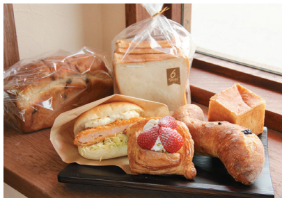
パン工房 コナリナ

東松島市矢本字大溜229-3 営/10:00~18:00 ※売り切れ次第終了 休/日・月曜