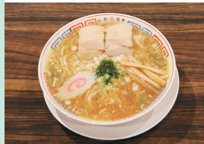
あごや 亞呉屋 本町店

東松島高の向かいに今年オープンし、早くも地域に溶け込んでいるパン店。食事系やハード系、菓子パン、総菜パンなど約50種を販売する。白神こだま酵母を使った「湯捏ね食パン」(324円)はしっとり、もちもちの食感で幅広い世代に好評。チョコと栗が入った「栗ショコラ」(248円)、「海老カツバーガー」(280円)もお薦めだ。