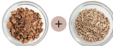
ダンディライオン