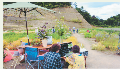
▲ハーブの栽培法のアドバイスもしてくれる

ハーブ70種の他、綿花や行者ニンニク、果樹などを栽培。夏はイブキジャコウソウ、ダブルフラワーカモミールで埋め尽くされた、香りの芝生が目に見える。ラベンダーも見頃を迎え、一面が紫色のじゅうたんになる。敷地内には直売所「山の駅たなっこ」があり、農園で育てた農作物や花、東松島市の特産品などを販売している。