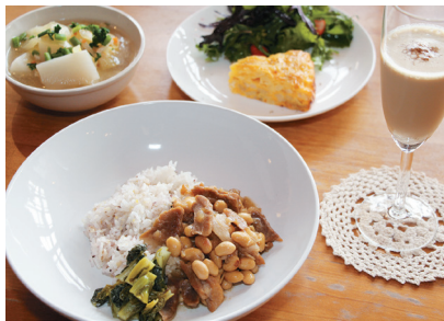
クリヤコーヒーロースタース KURIYA COFFEE ROASTERS

※価格は商品(1点)の総額(本体価格+消費税) ※LOはラストオーダー ※営業時間などは変更になる場合があります