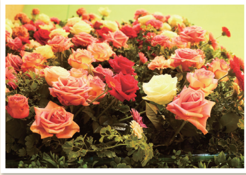
魅せられて(仙台市宮城野区) 多賀城市 佐藤玲子(76)