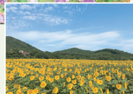
▶8月のヒマワリ畑も圧巻

加美町字味ヶ袋葉菜原1-9 開/10:00~17:00(最終入場16:30) 休/要問い合わせ 入園料/高校生以上700円、小・中学生200円 未就学児・障害者無料 ☎0120-67-7273(受け付け9:00~18:00)