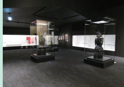
とよまかいこかん 登米懐古館

米や産直野菜、加工食品、地酒など、栗原市を中心に宮城県内のおいしいものを販売している。メンチカツをはじめ自家製総菜も好評だ。地元産「漢方牛」「漢方三元豚」は、すき焼きやしゃぶしゃぶ用などを用意する。併設の「おかまる食堂」では「漢方牛」「漢方三元豚」(1650円)や「漢方三元豚ロースカツ」(1518円)などが楽しめる。