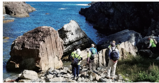
「宮城オルレ 気仙沼・唐桑コース」にある「神の倉の津波石」を眺める参加者

学園では卒業生全員を「生きがい健康づくり推進協力員」に委嘱。卒業後も2年間の学園生活で得た知識や経験を生かし、地域のシニアのリーダーとして継続的に活躍してもらっている。本大会はその活動の一つ。