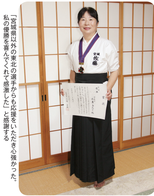
「宮城県以外の東北の選手からも応援をいただき心強かった。私の優勝を喜んでくれて感激した」と感謝する

初めてのねんりんピックで、女子60〜69歳5キロの部に出場。23分35秒でゴールし、4位に入賞した。