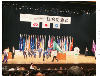
和歌山県民文化会館で行われた総合閉会式

2日目から開催された交流大会で、宮城県勢は日頃の練習成果を発揮。団体種目は卓球、ゲートボール、ソフトバレーボール、剣道が予選リーグ1位通過、サッカーがリーグ2位、なぎなたがベスト16に入賞しました。