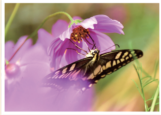
ちょう 蝶とコスモス(仙台市泉区) 仙台市泉区 大橋光男(83)

が鮮明によく分かり、85年を振り返るのに役立ちます。これからますます、日誌と「人生のあゆみ」は書き続けていくつもりです。88歳の米寿、90歳の卒寿までも作成できるような健康に留意しながら長生きをし、地域の子どもたちを安全で安心できるよう見守り続けながら長生きをしたいと願っています。