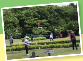
パークゴルフ大会

日本アカデミー賞最優秀主演男優賞、文化庁芸術 祭演劇部門大賞。10年紫綬褒章受章。