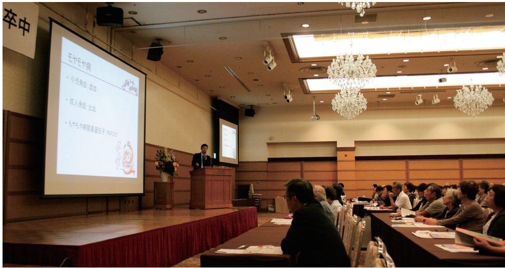
多くの市民が熱心に聴き入った「つながる健康講座」

東北大学病院(仙台市)が県内各地で開催し、私たちが気になる病について専門医が原因や症例、最新の治療法、そして予防法を分かりやすく教えてくれる「つながる健康講座」。その3回目が先ごろ、石巻市内のホテルで開かれた。今回のテーマは「知って備える脳卒中」。三大成人病の一つで関心の高い病気だけに、多くの市民が来場し、医師の説明に聴き入った。