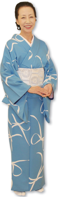
発表会には着物姿で出演

知り合いに誘われて SUN クラブに入り、2014年の立ち上げ時から「SUN民謡サークル秋の会」の一員として活動しています。日本舞踊は30年ほど習っていて、よく民謡に合わせて踊っていました。とは言っても、民謡を本格的に歌うのは初めて。最初は人前で歌えるか不安でしたが、会の雰囲気がとてもいいので楽しく続けられています。 会員は立ち上げ当初8人でしたが、今では20人ぐらいに増えました。男女の比率が半々でバランスが良く、皆、とても仲良し。80代以上はつらつとした先輩方を見てると、私ももっともっと元気に過ごしたいと励みになります。 活動は第2・4水曜13〜15時に、仙台市の宮城野区中央市民センター3階の和室で行っています。最初は全員で宮城の民謡「さんさ時雨」を歌い、次に一人ずつ好きな曲を歌います。尺八や三味線、おはやしが得意な会員の演奏に合わせて歌う機会もあり、とても