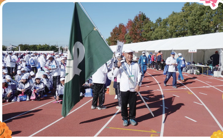
総合開会式で宮城県旗を持つ選手