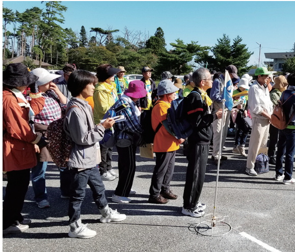
秋晴れの下、多くの参加者でにぎわった気仙沼・本吉地区大会

宮城いきいき学園の卒業生が企画する「生きがい健康づくり地区大会」が先ごろ県内5地区で開かれ、それぞれの地区住民が多数参加してスポーツを楽しんだ。 気仙沼・本吉地区大会は新しい試みとして昨年10月にオープンした「宮城オルレ 気仙沼・唐桑コース」でトレッキングを実施。学園の在校生、卒業生や同地区住民120人ほどが参加した。参加者は6班に分かれ、ガイドの案内で太平洋の青い海を眺めながら4キロのコースを3時間かけて満喫した。 コース上で以前は船着場だった所に、東日本大震災の大津波で海底から打ち上げられた巨大な岩「神の倉の津波石」では、津波の威力を目の当たりにして震災の大きさを実感していた。