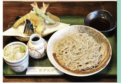
そばとガレット SOBA to GALETTE あずみの

秋保温泉近くにあるそば店。築30余年の空き家を改修した店内には、江戸時代から昭和にかけて作られた仙台筆筒が5台置かれている。自慢の手打ちそばは「戸隠そば」で知られる長野・戸隠産のそば粉を使用。香り豊かで喉越しが良く「天ざる」(写真・1500円)などが好評だ。そば粉と塩、水だけで作るガレット(950円から)も提供する。