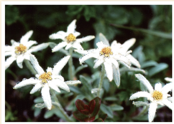
ミヤマウスユキソウ(秋田駒ヶ岳) 仙台市青葉区 菅野拓(71)