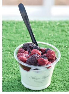
アトレイユ ヨーグルト工房 Atreyu 蔵王本店

イタリア製窯を使って焼き上げる風味豊かな「ナポリピッツァ」が自慢。イタリアなどで腕を磨いた職人が「マルゲリータ」(写真・1200円)などの定番メニューから、セリやハーブといった宮城県産食材を積極的に活用した季節限定品まで毎日15種を用意している。サラダとドリンクが付いたランチは1000円。