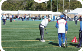
▲好天の下、集中してボールを打つグラウンドゴルフの選手