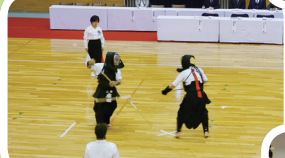
▲緊迫した雰囲気にも包まれたなぎなたの試合