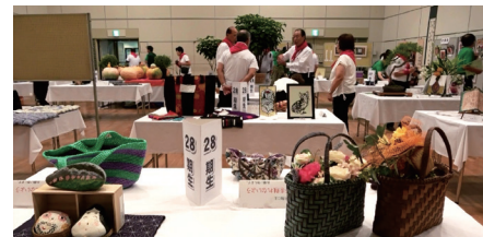
学園生や同窓生の力作が並んだ展示スペース