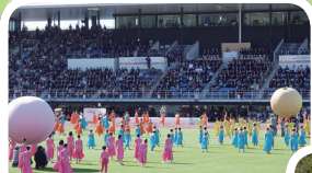
▲カラフルな衣装の出演者が総合開会式でパフォーマンス

今大会は和歌山県の9市12町を会場に、27種目の熱戦が繰り広げられた。宮城県からは18種目19チームが参加。開会式や閉会式、宮城県の選手の活躍を紹介する。