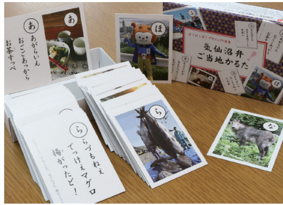
ば!ば!ば!プロジェクト「気仙沼弁ご当地かるた」

気仙沼の魅力を紹介する団体が企画・制作し、9月に発売したご当地かるた。読み札は市内の方言や名物、風習、観光地などを盛り込み、五七五のリズムになっている。標準語訳付き。市民らから募集した写真をイラスト風に処理・修正した絵札もユニークだ。家族だんらんを盛り上げるアイテムにしてみよう。1650円。