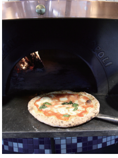
ピッツェリア イル エリアント pizzeria il elianto

岩沼市桜5-6-23 営/11:00~LO15:00、17:30~LO21:00 休/月曜(祝日の場合は営業、翌火曜休み)、 臨時休あり、年末年始休は要問い合わせ TEL0223-36-9351