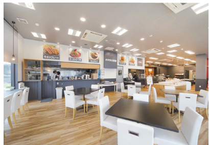
おかってマルシェ

仙台市太白区秋保町湯元字枇杷原11-2 営/11:00~17:00 休/火曜、12月25日(水)、2020年1月以降の第1・3水曜、年末年始休は要問い合わせ TEL022-398-6253