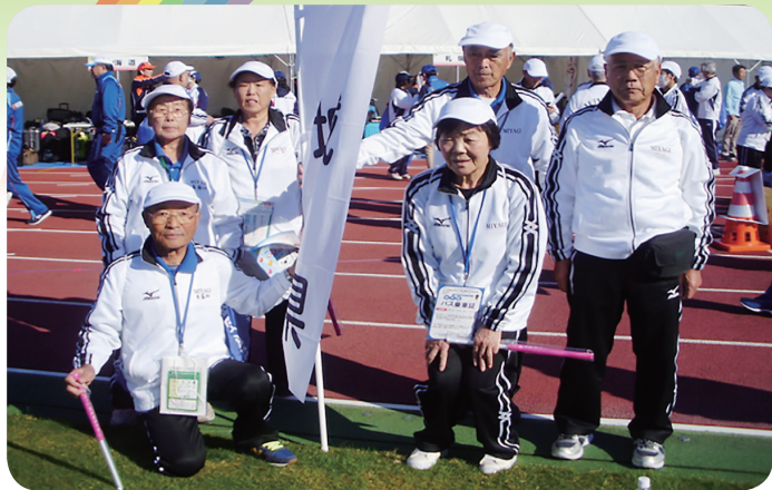
開会式に臨むメンバー。「遠い所だが、良い思い出になった」と全員喜んだ