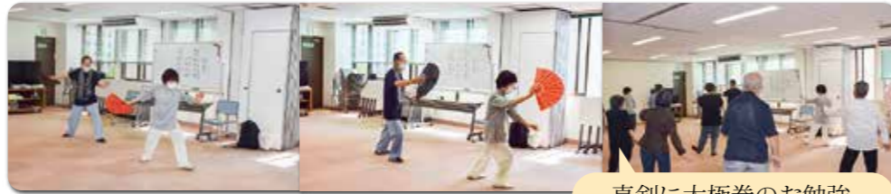
真剣に太極拳のお勉強

健康で明るく楽しい教室にしたい と思います。また、中国の奥深い趣 味も味わえると思います、よろしく お願いいたします。