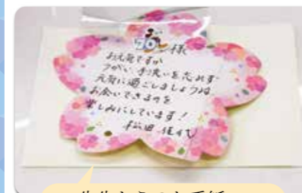
先生からのお手紙、 可愛いですね♡