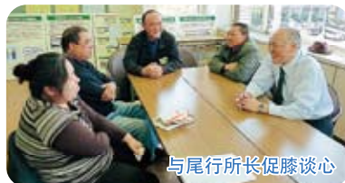
与尾行所长促膝谈心

挑战烹饪代表家乡风味之一的猪肉酱汤和什锦饭的各位发出了「是初次做猪肉酱汤」「能够做出这么好的味道真是太高兴了」等的感想。与此同时，在畅谈小组当中，还有归国者与是在同一天回到日本的友人实现了阔别25年之久的重逢！对于分散居住的归国者们来说是共聚一堂的宝贵机会。今后，也希望能够为更多的归国者们提供可以参加的机会。