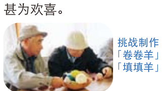
挑战制作「卷卷羊」「填填羊」

在つなぎ温泉清温庄，通过体验洗温泉・意见交换会加深了彼此之间的交流。初次参加交流会的归国者还表示「虽然是初次见面却感觉像是旧友重逢一样」，甚为欢喜。