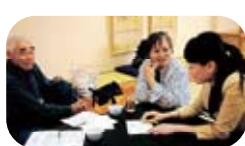
「交流会、感觉怎么样？」