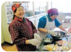
材料丰富的猪肉酱汤和什锦饭