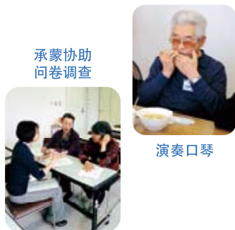
承蒙协助问卷调查