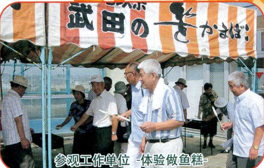
参观工作单位 体验做鱼糕