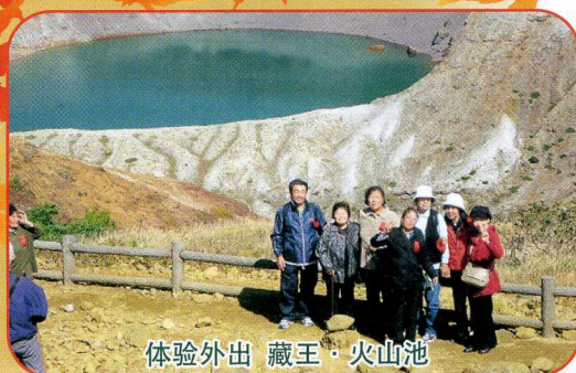
体验外出 藏王・火山池