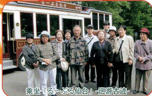
乘坐「るーぶる仙台」-巡游古迹-