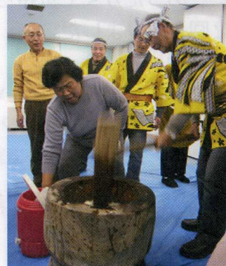
十二月五日 捣年糕 缠着头巾穿着号衣真帅！