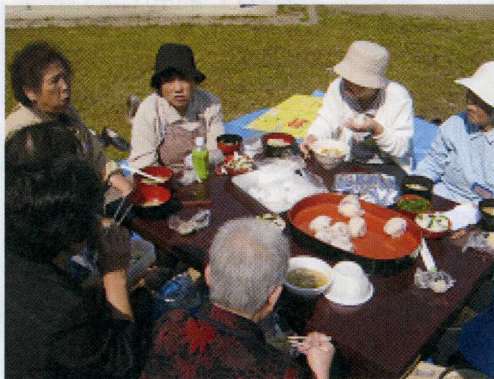
十月三日 芋煮会 在水之森公园