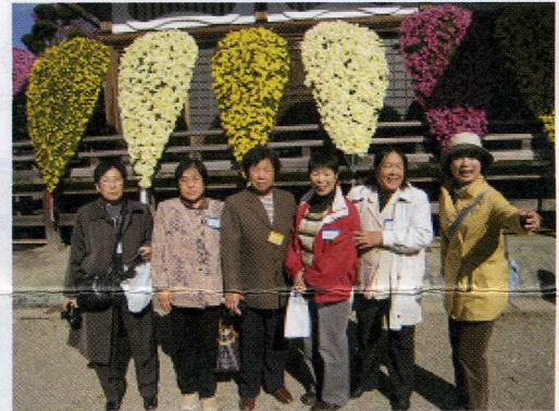
11月4日~5日 旅游(住一夜) 最上川游览→鸣子温泉→平泉