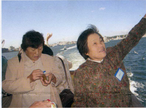
九月二十五日 参观松岛 天公作美

东北中国归国者支援・交流中心 社会福祉法人 宫城县社会福祉协议会 邮编：980-0014 宫城县仙台市青叶区本町3-7-4 电话：022-263-0948/022-223-1152 网址： http://www.miyagi-sfk.net/