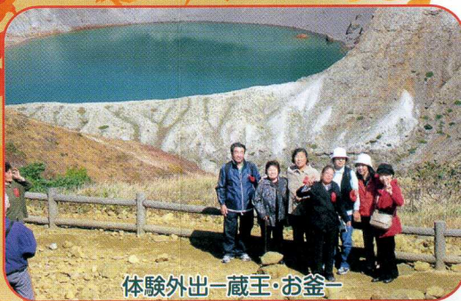
体験外出—蔵王・お釜—