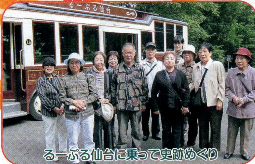
る—がる仙台に乗って史跡めぐり