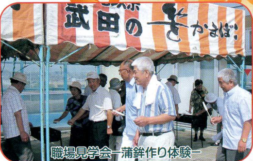
職場見学会—蒲鉾作り体験—