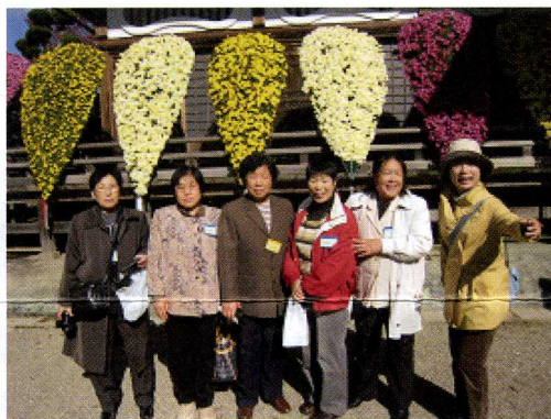
11月4日・5日 一泊旅行 最上川舟下り→鳴子温泉→平泉