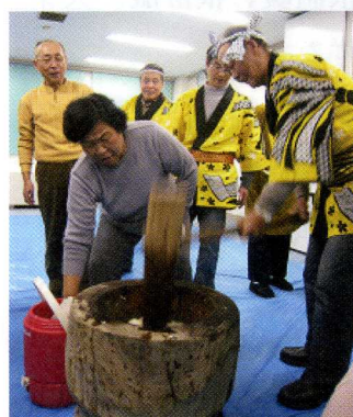
十二月五日 もちつき はちまきこハッピー、 きまっています！