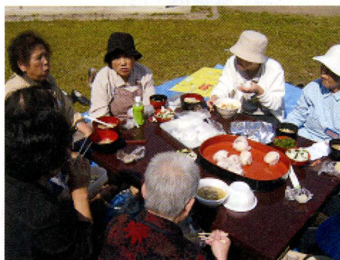
十月三日 芋煮会 水の森公園にて