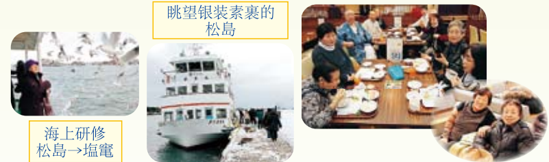
眺望银装素裹的松岛

在移动的大巴上、温泉里、自助餐时，大家由始至终谈笑风生，好友之间更是推心置腹，度过了温馨和谐的时刻。