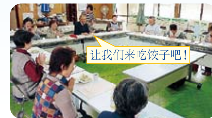
让我们来吃饺子吧!

平成24年度以东北六县的60名归国者为对象实施的问卷调查(※)结果显示，关于与左邻右舍的交往情况，回答「只限于问候(点头)程度的人」为49.5%占全体的5成、「有见面时能站着闲聊程度关系的人」占23.7%、「有可以互相去对方家里做客程度关系的人」仅占15.3%。