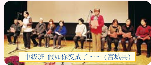
中级班 假如你变成了~~(宫城县)