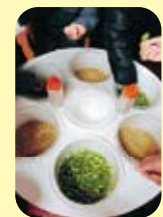
亲自触摸麦芽和啤酒花

15名归国者参加了本年度最后一次参观企业的活动。大家亲手触摸机器和原料，还试尝、试饮等。对于初次的“体验型”参观，大家都深表关心，兴致勃勃地了解了详细过程。同时，对工厂内的工人之少、最先进自动化设备的生产线感到惊叹并深铭肺腑。还听到了「不愧是技术大国的日本、真是太了不起了」的感慨。在试饮会场，大家举杯畅饮了只有在工厂里才可以享受到的刚刚榨出的无与伦比的新鲜啤酒。