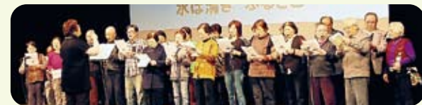
归国者们一起合唱