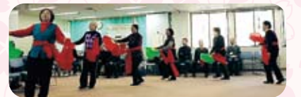
为平素承蒙关照的志愿者们扭秧歌