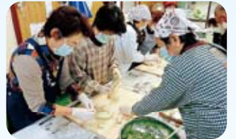
与地区的各位一起

经常在家里包饺子的主妇们都称赞，由归国者们传授的水饺子别具味道「今后在家里也想尝试从擀饺子皮开始做」。归国者们也都绽放笑容纷纷表示「能让町内会的各位满意我们也由衷的高兴」。另外，时常在町内会的清扫活动中碰面，或是在接送孙子时大家也相互致意，但却只限于寒暄程度。本次活动为苦于没有攀谈时机的各位提供了亲密交流的绝好机会，使大家都为一下子缩短了彼此之间的距离而甚是欢喜。