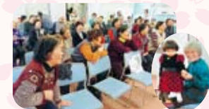
出神地观赏着口技的大家

由志愿者小组回声会的各位为大家表演了歌曲、舞蹈及口技等丰富多彩的文艺节目。大家都开怀大笑，是一次愉快而开心的集会。