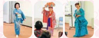
使大家有机会欣赏了日本舞蹈、琉球舞蹈等传统文化及日本的名曲和童谣