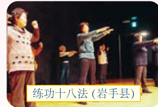
练功十八法(岩手县)

通常发表者是极为紧张的，但让人感到随着发表会次数的增加，「大家共享欢乐!」的趋势也愈发高涨起来。不仅使归国者们、会场的来宾也使主办方愉快地观赏了一场自编自演的发表会。