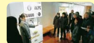
当场为大家演示封盖工序