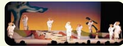
由仙台老年剧团「まんざら」演出话剧「花一匂」

在宫城县仙台市举办了由厚生劳动省主办的论坛会。借此契机使普通市民加深了对归国者们至今为止所走过的苦难历程及其现状等的了解。