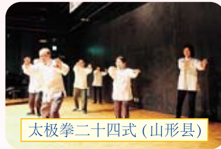
太极拳二十四式(山形县)