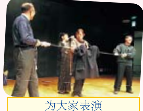
为大家表演精彩魔术的小池女士