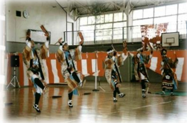
県指定無形民俗文化財 新城の田植踊