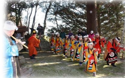
県指定無形民俗文化財 廿一田植踊