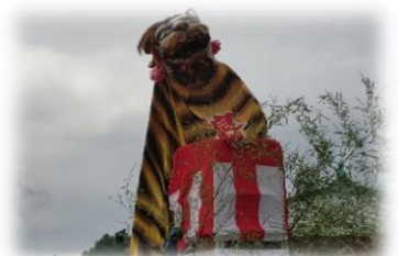
県指定無形民俗文化財 浪板虎舞