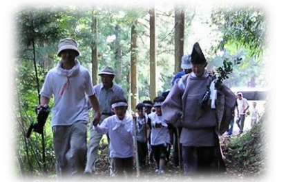
国指定重要無形民俗文化財 羽田のお山がけ