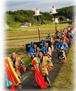
市指定無形民俗文化財 山田大名行列