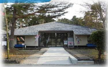
唐桑半島 ビジターセンター