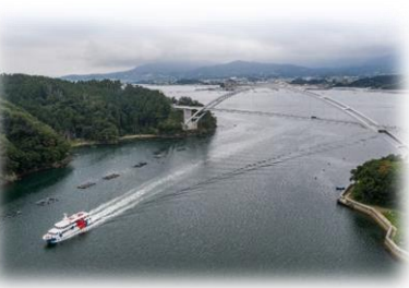
気仙沼バイクルーズ