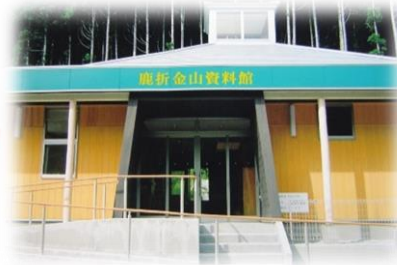
気仙沼市 鹿折金山資料館