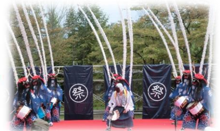
県指定無形民俗文化財 早稲谷鹿踊