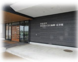
気仙沼市 東日本大震災遺構 伝承館