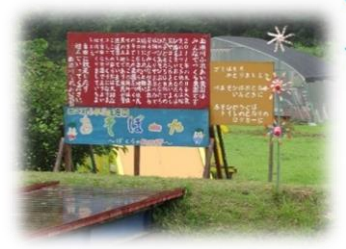
面瀬ふれあい農園