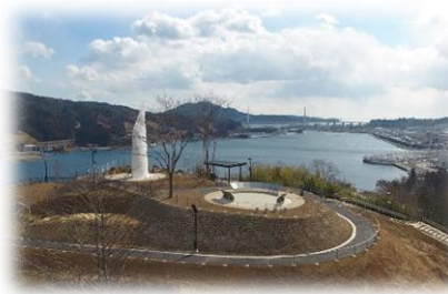
気仙沼復興祈念公園