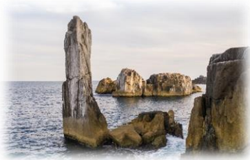
県指定名勝 巨釜半造