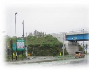
気仙沼三陸道路中央