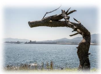
三陸復興国立公園 岩井崎