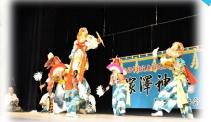
市指定無形民俗文化財 塚沢神楽