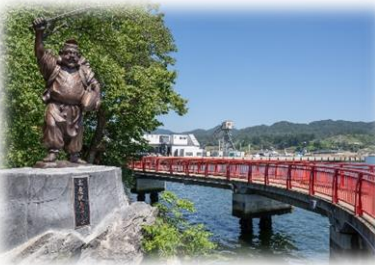
気仙沼湾神明崎三代目 恵比寿像