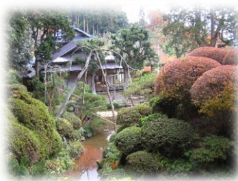
国指定名勝 煙雲館庭園