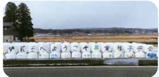
東根地区の子供会がつくった“安全運転”を伝える「ロールペールラップサイロ」