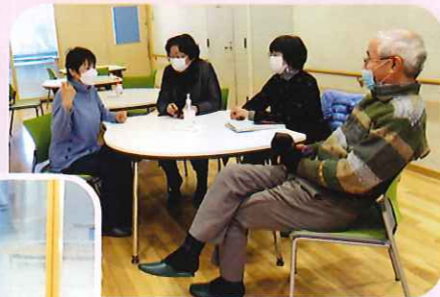
※感染予防のため 飲食はしていません。