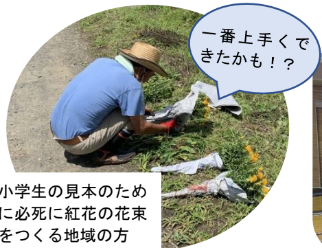
一番上手くて きたかも！？