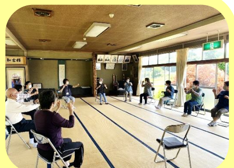
2回目にはなんとメンバーのみなさんが講師となりダンベル体操を実施！