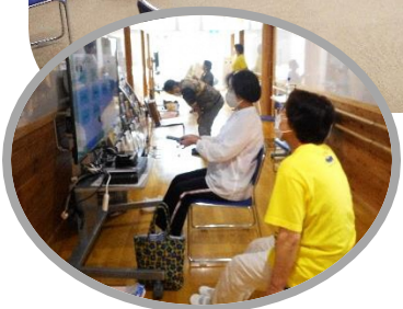
→アプリゲーム 利用の様子

「なるべくなら長く安全に運転していたい！」 運転寿命を延ばすために、アプリゲームを使って脳を鍛える「シニア倶楽部」が7月より再開しました。7月5日（月）の初回オリエンテーションには、15名の方が参加してくださいました。自粛期間中、頭だけではなく、身体を使う機会も激減していたことから、初回は健康運動士の先生から運動を教えていただくのを中心に。7月12日（月）からは実際にアプリゲームを利用いただいています。この倶楽部もまだまだ試行運転中。現在は毎週月曜日の午後13:30~15:30の間でシニア倶楽部の活動に来所いただいた方に限定し、次回の予約を受け付けています。興味のある方は、まずは月曜日の午後に、一度、覗きにいらしてください。