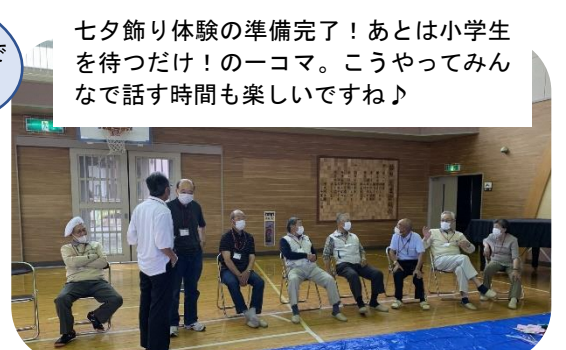
七夕飾り体験の準備完了！あとは小学生を待つだけ！の1コマ。こうやってみんなで話す時間も楽しいですね♪