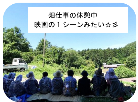
畑仕事の休憩中 映画の1シーンみたい☆彡