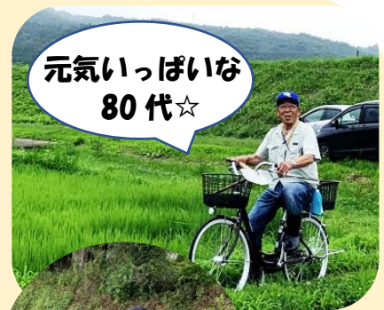
元気いっぱいな 80代☆

趣味と聞かれたらスポーツ観戦を一番に挙げる。ご自身も昔、ソフトボールに魅了され、男女別にチームを2つも立ち上げ、長年監督の役割も担っていたそうです。現在もウォーキング、グラウンド・ゴルフ、ペタンクといったスポーツ活動も行っていきます。それだけではなく、子どもたちに昔の生活、田植えや畑作業を教える活動でいろんな手作りの作品を見せてくれるのも印象的です。昔からなんでも自分で作ってしまうタイプ。その方が安いからと話すものの、どうしたら作れるか、設計図を考えることが楽しいからとのことでした。また、家の前で散歩している人を見かけたら「畑で収穫した野菜を持って行って」とすぐ声を掛けてしまいます。昔から何かやってあげたくなる性格で、奥様からはいつも知らない人にも声を掛けて怒られてしまうけれど、やっぱり「人との繋がりを切らさないこと」が大切と、元気でいる秘訣についても教えていただきました。