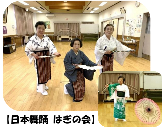
【日本舞踊 はぎの会】

日本舞踊、老人クラブのグラウンド・ゴルフ大会、ペタンク大会など感染対策に気をつけながら少しずつ地域の活動が再開しています。現在、みなさんが定期的に参加できる村田町内の活動情報をまとめています。近日中に公開予定！お楽しみに♪