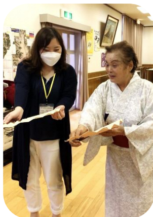
日本舞踊に初挑戦！