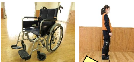
車いす（下肢障がい） 高齢者疑似体験セット

涌谷町社協の職員等が出向く「わくわく出前講座」(P.2~P.6) を利用しない場合、物品のみの貸出にも対応しております。