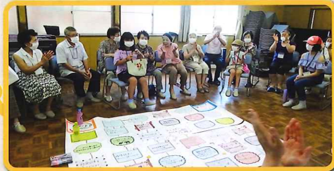
2 地域のサロン「にこにこ会」にお持ちして