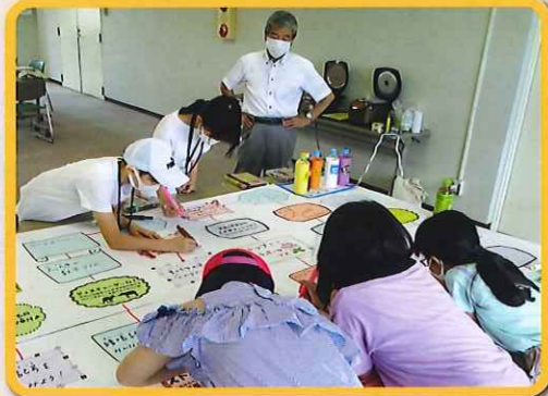
1 小学生がオリジナルで「オゴロク」を作りました。

8月3日に小学生を対象に行った「ボランティアスクール」にて本町2区サロン「にこにこ会」の方と交流を行いました。