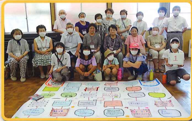
4 最後はみなさんでパシャリ