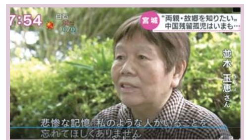
悲惨な記憶、私のような人がいることを忘れてほしくありません