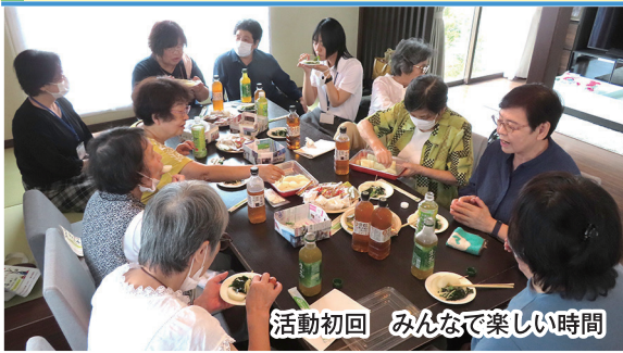
活動初回 みんなで楽しい時間

近所の人達と集まっておしゃべりする場が欲しいと声上がり「みんなでお茶会しましょう！」と令和5年7月に立ち上げました。まだ3回程の集まりで、“会”は手探りの状態ですが、これからみんなで話し合いながら活動していきます。